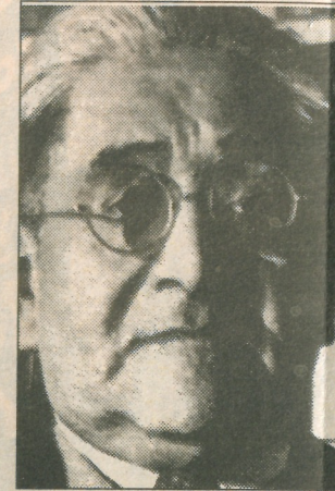
Su inquietud por la arqueología llevó al sabio Julio C. Tello a explorar los monumentales restos de Chavín de Huantar.

"Yo he trabajado con mi padre. Él se ponía polainas y su saco, cogía sus instrumentos y se iba al campo. No recurría a los sapientes, a los académicos, sino a los que supuestamente menos saben. Era amigo de los huaqueros. Ellos le daban buena información", resaltó.