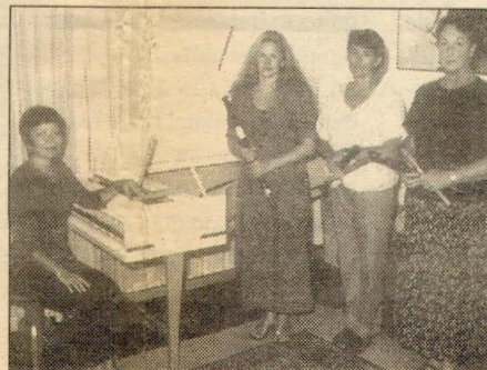
En el Centro Cultural de la Católica los miércoles del mes están dedicados a la música clásica, a cargo de experimentados intérpretes.

Según Ardiles, una solución podría ser que organismos o universidades extranjeras se interesen por estudiar estos lugares y puedan financiar la construcción de una muralla para proteger los 50 sitios que existen en Pachacámac. (AFP)