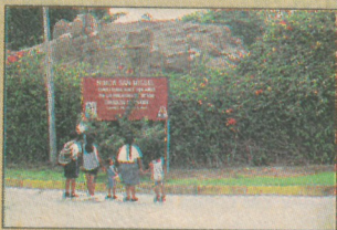
1 Huaca San Miguel