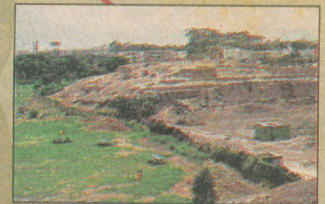
3 La Cruz