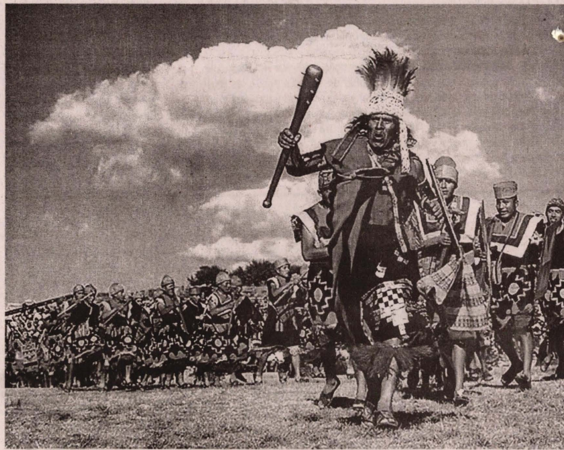
●EL PRIMER INCA habría sido Túpac Ayar Uchu, llamado Pirua Pacari Manco.

* Conferencia ofrecida en radio Filarmonía (Lima), el 18 de junio de 2018.