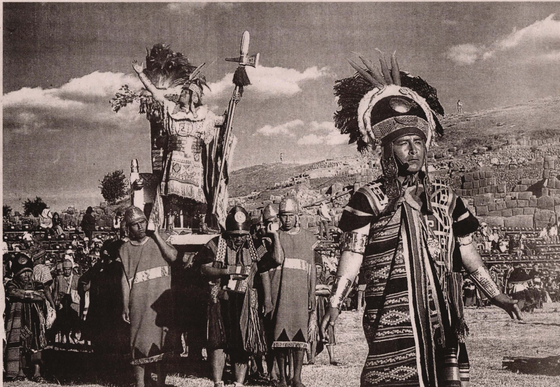
●SEGÚN ESTA TESIS más de 100 habrían gobernado el imperio de los incas durante 1000 años.

Cuzco y ha sido profesor de esta en universidades europeas. Asimismo, ha sido investigador, en universidades polacas, y catedrático en la Universidad Nacional de San Cristóbal de Huamanga, en la Pontificia Universidad Católica del Perú y en la Universidad Hebrea de Jerusalem.