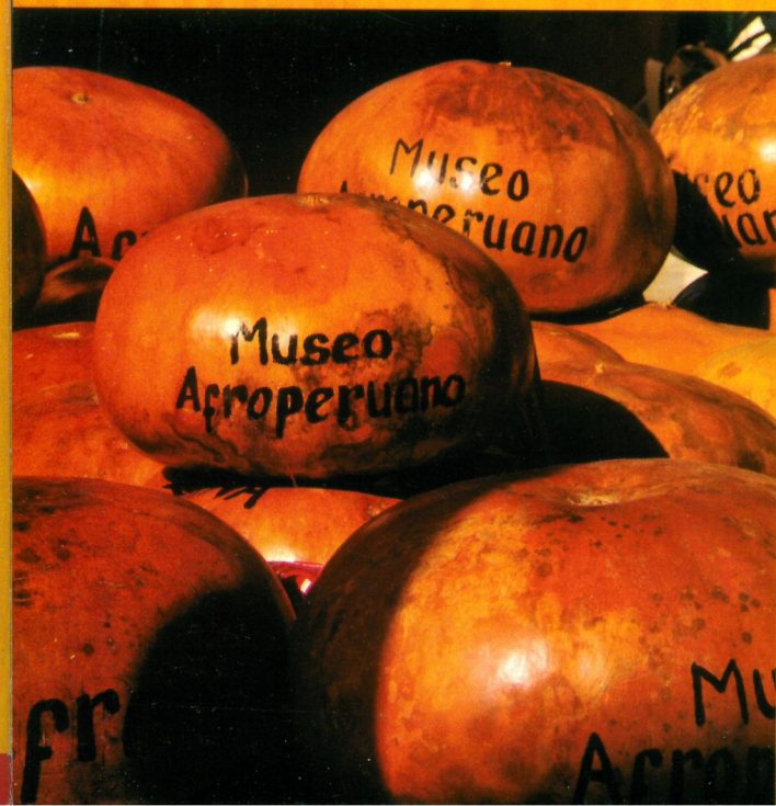
Conjunto de checos o calabazos ovalados.

Es un instrumento musical único en las Américas y en el Perú y está asociado al antiguo género danzario "baile tierra". Atrae su belleza natural y la variedad de sonidos que emite. El 4 de noviembre de 2011 el uso musical del "checo" fue declarado patrimonio cultural de la Región Lambayeque.