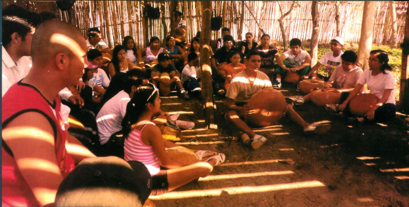
Niños y jóvenes de varias localidades de la región Lambayeque aprendiendo a tocar checo.

La institución orienta su trabajo en función de cuatro ejes temáticos: investigación de historia y cultura de la diáspora africana; salvaguardia de instrumentos musicales, cantares y danzas antiguas; promoción de las culturas vivas de los afrodescendientes, desarrollando la etnoeducación; y los intercambios culturales con miembros de instituciones de la diáspora africana.