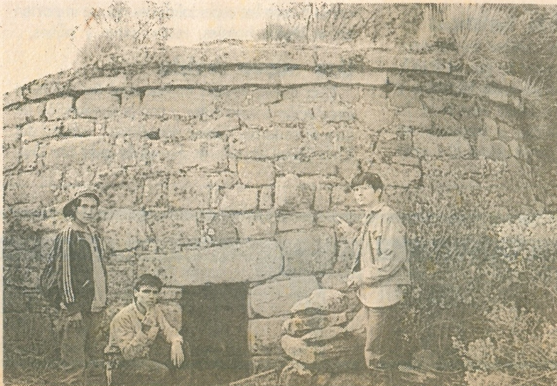
Chullpas de Pumacoto, en la provincia de Canta, al noreste de Lima.