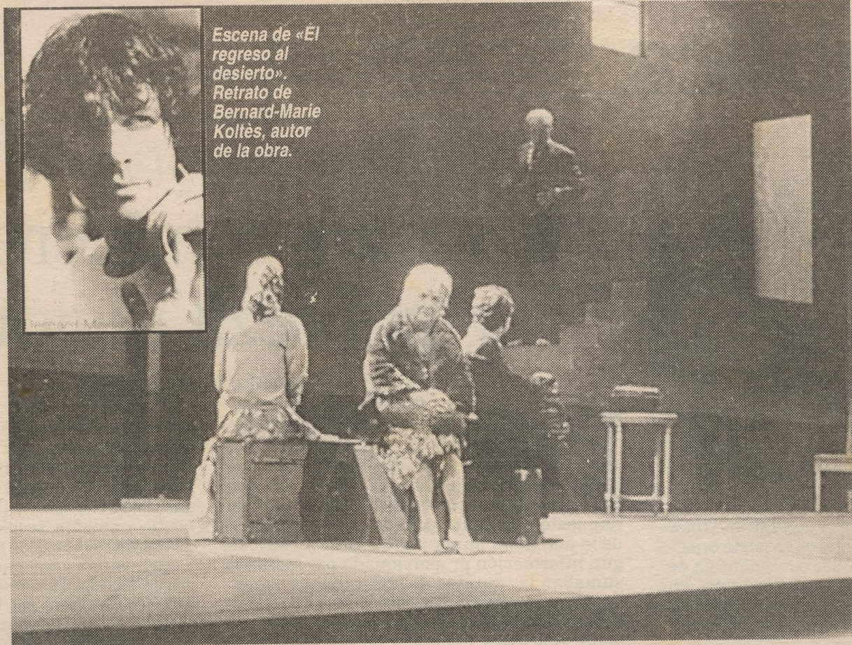
Escena de «El regreso al desierto». Retrato de Bernard-Marie Koltès, autor de la obra.