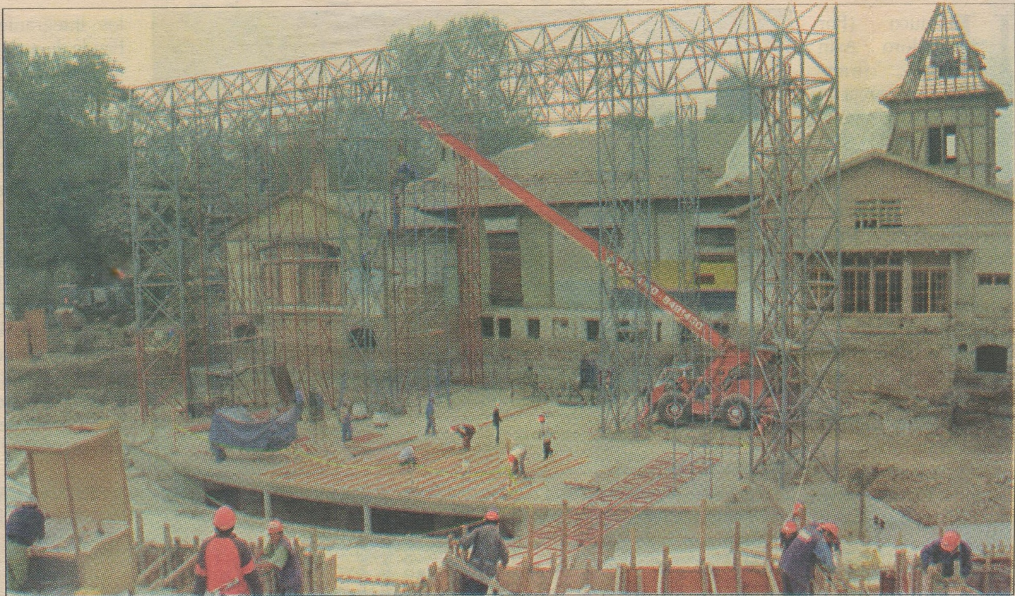
El antiguo local de La Cabaña está siendo remozado íntegramente, manteniendo su tradicional arquitectura. Abajo, detalles del anfiteatro al aire libre y de la futura laguna artificial que tendrán el gran Parque de la Cultura de Lima.

Y hablando de anfiteatros, el Museo de Arte de Lima también tendrá el suyo y