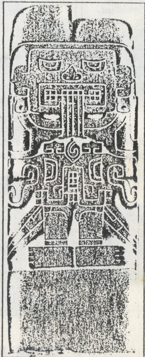
Monolito de PACOPAMPA. Representa a personaje felinico con cola de ave.

PACOPAMPA parece haber recibido también ofrendas que venían de otras sociedades contemporáneas por lo que se convierte en unos 400 kilómetros al norte de Chavín.