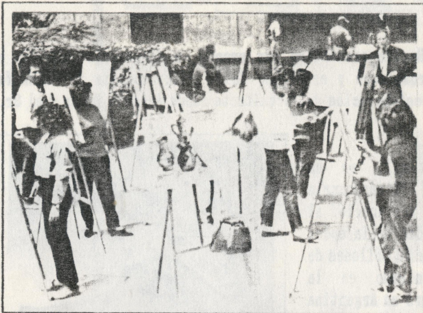
EL TALLER DE PINTURA ES DIRIGIDO POR RECONOCIDOS PROFESIONALES

Con gran éxito se inició los Talleres de Arte - Verano 1994 en el Museo de la Nación, el cual está dirigido a todas las personas de diferentes edades y en las más variadas disciplinas.